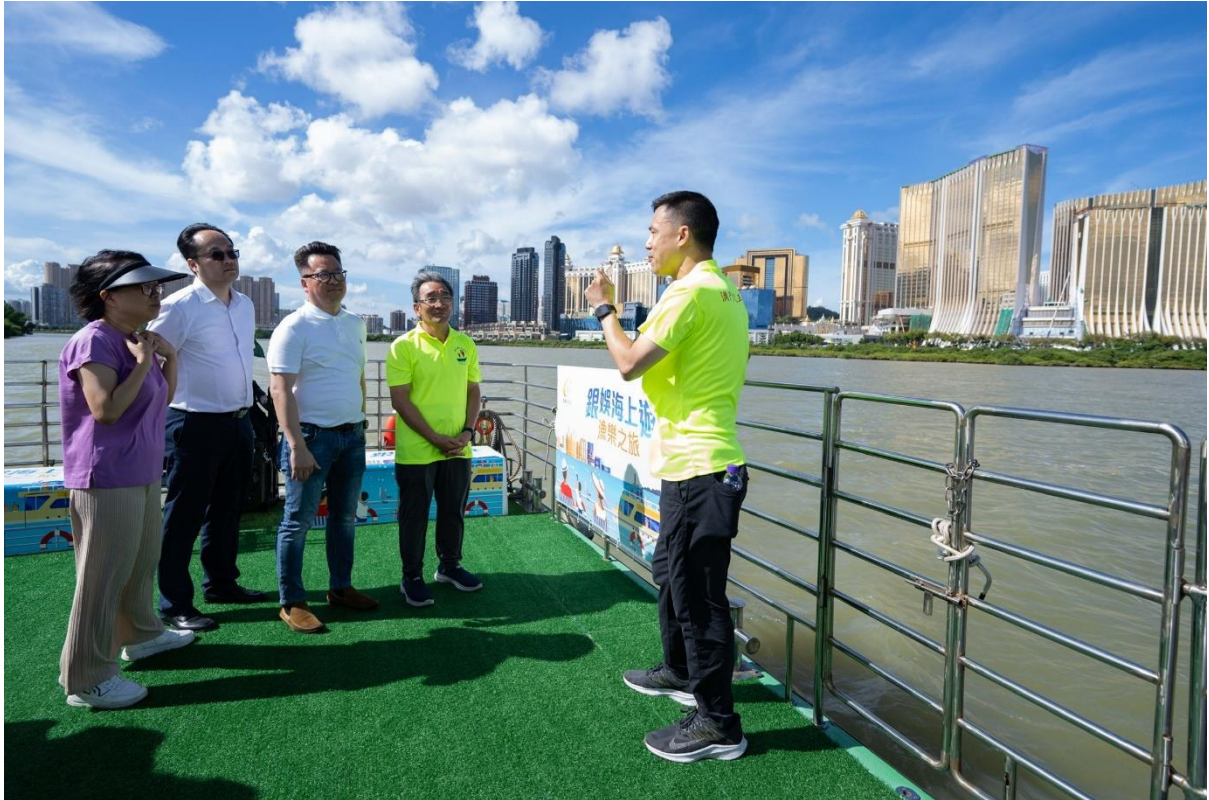
P002：澳門漁民互助會代表帶領嘉賓及參加者在船隻甲板上飽覽澳門的城市與海岸風光。