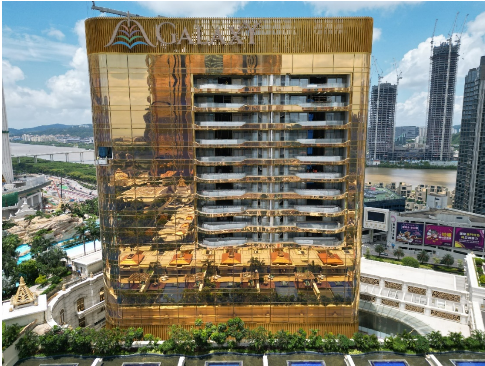
澳門銀河 嘉佩樂之最新近照(2024年8月)