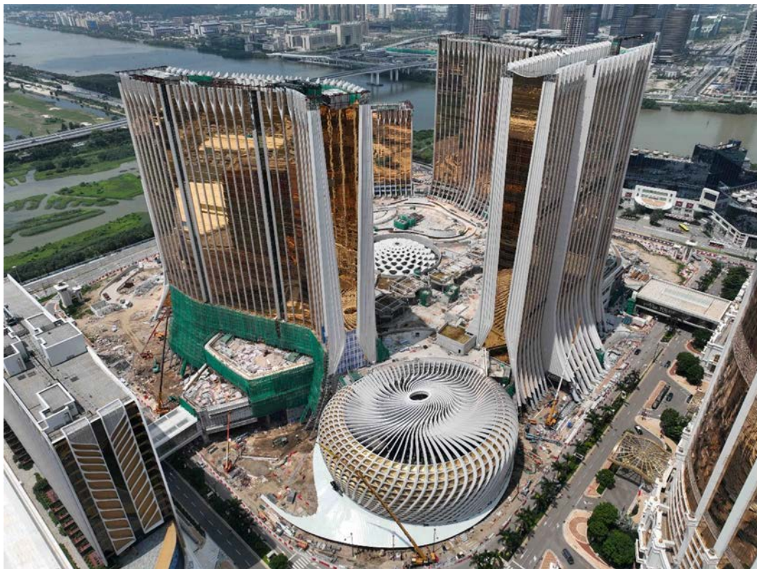
路氹第四期之最新近照(2024年8月)